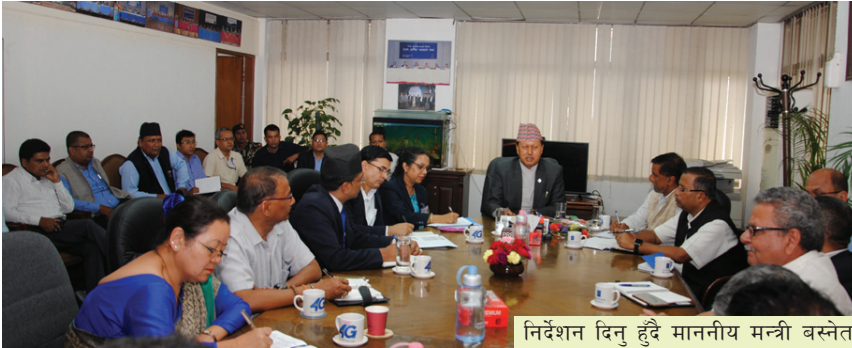
निर्देशन दिनु हुँदै माननीय मन्त्री बस्नेत

सूचना तथा सञ्चार मन्त्री मोहन बहादुर बस्नेतले गत भाद्र ५ गते नेपाल टेलिकम केन्द्रीय कार्यालयको निरीक्षण भ्रमण गरी विभिन्न निर्देशन दिनु भएको छ।