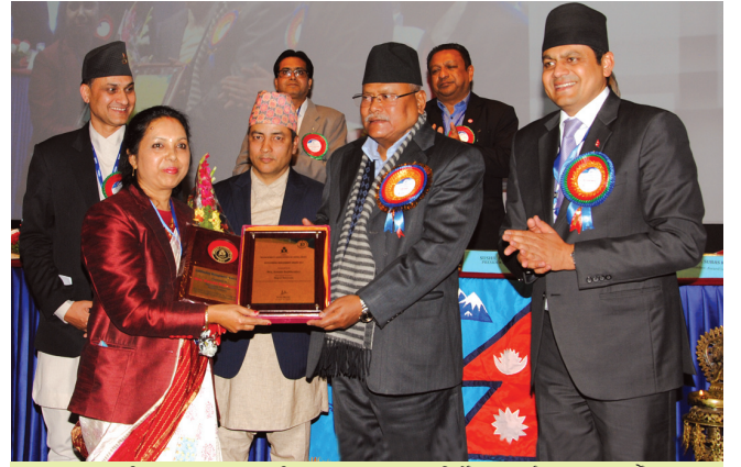
तत्कालीन उप प्रधानमन्त्री गच्छदार प्रबन्ध निर्देशकलाई सम्मान गर्दै।