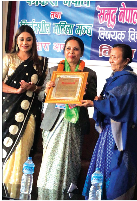
तीन नं. प्रदेश प्रमुख कोइराला प्रबन्ध निर्देशकलाई सम्मान गर्दै ।

नेपाल टेलिकम र चाइना टेलिकम ग्लोबल वीचको क्रसबोर्डर अष्टिकल फाइबर लिंक गत २०७४ पुस २८ बाट व्यावसायिक सञ्चालनमा आएको छ । लामो समयको प्रयास पछि सो रुटबाट इन्टरनेसनल ब्यान्डविथको इन्टरकनेक्सन सञ्चालनमा आएको हो । अब नेपालको सूचना महामार्ग भारत र चीन दुवैतिरबाट